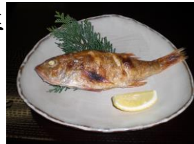
ノドグロの塩焼き